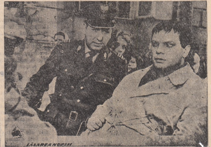
ÎN CLIȘEU: Un cadru din film.

Odată planurile puse la punct, Jacenko trece la fapte. Cînd mașina cu bani se apro-