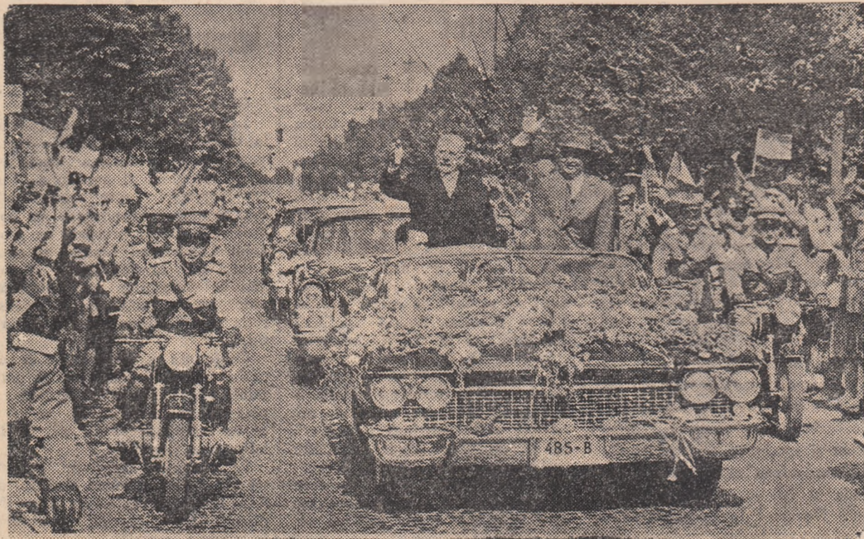
Sosirea în București a delegației de partid și guvernamentale a Republicii Democratice Germane în frunte cu tovarășul Walter Ulbricht.