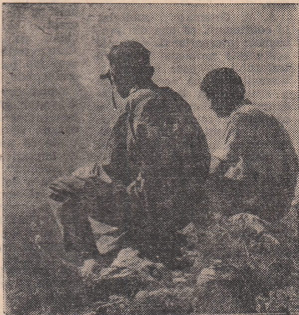
Admirînd frumusețea Bucegilor.

Au urmat recitări de epigrame, cîntece, mult aplaudate de studenți, în unele împrejurări chiar și din... complezanță... Epigramele