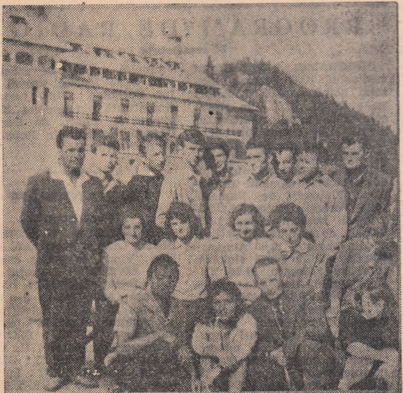
Grupul de studenți de la I.M.P. care a fost în tabăra de la Pîriul Rece.

Cînd autobuzul nostru cobora pe serpentinele Pîriului Rece (unde nu e pîriu) am privit cu regret spre batistele ce fluturau și spre melegurile care săptămîni de-a rîndul au răsănat de atîta rîs tineresc.