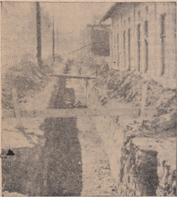
Tot centrul orașului Vulcan a devenit un șantier.

IN CLIȘEU: A început și termoficarea orașului. Șanțurile adânci așteaptă conductele de termoficare.