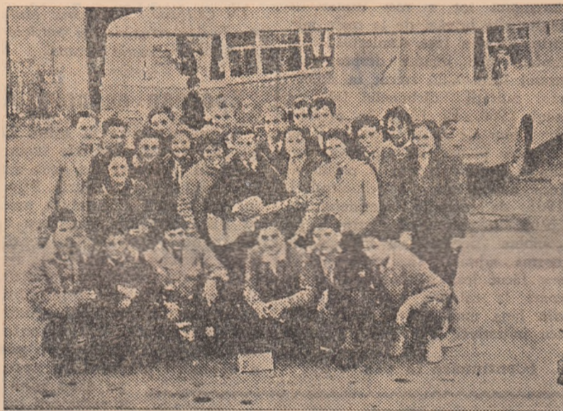
Valea Jiului, cu frumusețile ei naturale, este vizitată des de către excursioniști din toată țara. Vara, excursiile școlare se țin lanț, iar acum toamna în fiecare duminică vin grupuri de excursioniști — oameni ai muncii — care vizitează orașele noastre, cabanele turistice.

IN CLIȘEU: Un grup de excursioniști de la Hunedoara în vizită la Petroșani. Grupul a ținut să se fotografieze în orașul nostru.