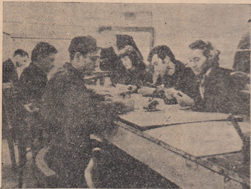
La clubul sindicatelor din Lupeni s-a înființat de curând un cerc de artizanat pe care îl frecventează 57 de amatori adulți și 31 școlari.

IN CLIȘEU: Un aspect din cercul de artizanat.