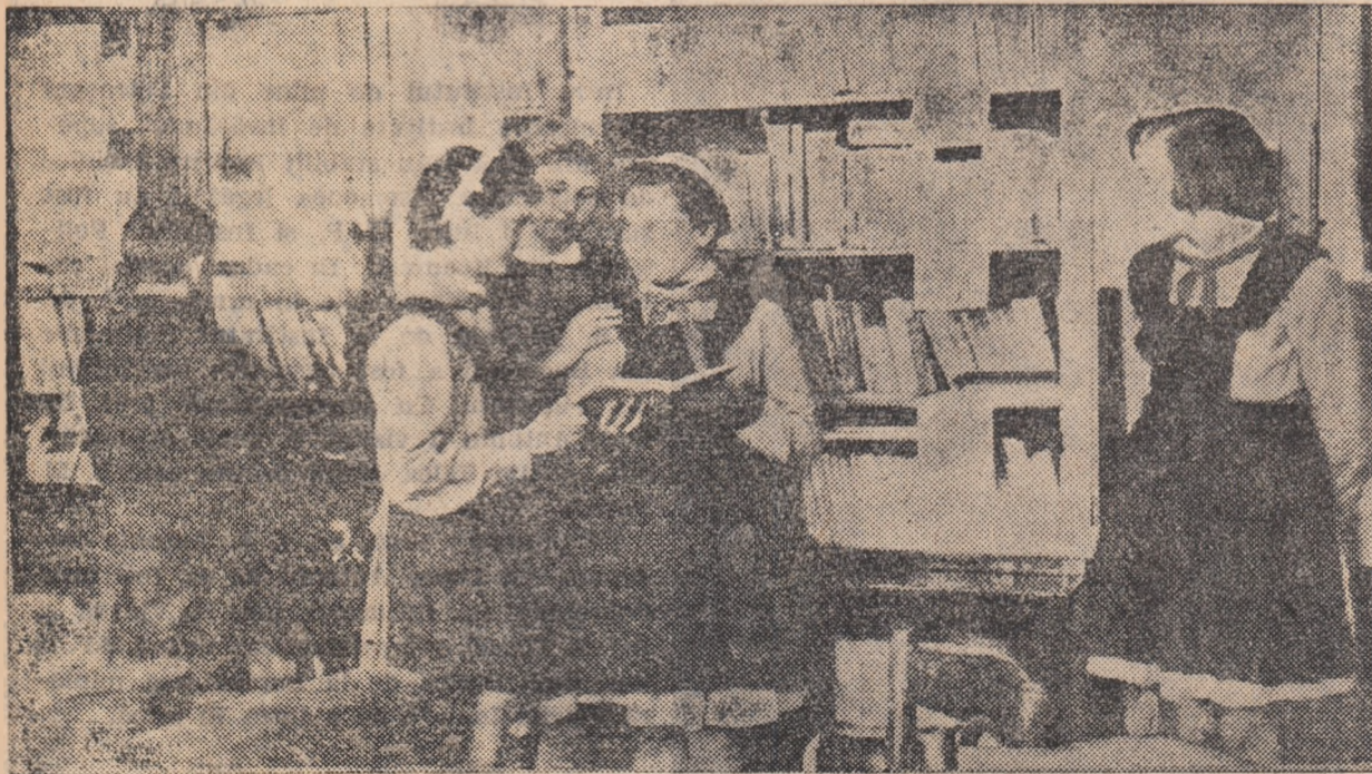
Școala de 8 ani nr. 1 din Lupeni dispune de o bibliotecă bogată cu citeva sute de volume. Elevii școlii, la fel ca și cadrele didactice, sînt cititori activi ai bibliotecii. Aici ei găsesc cărți pentru toate gusturile și toate vîrștele.