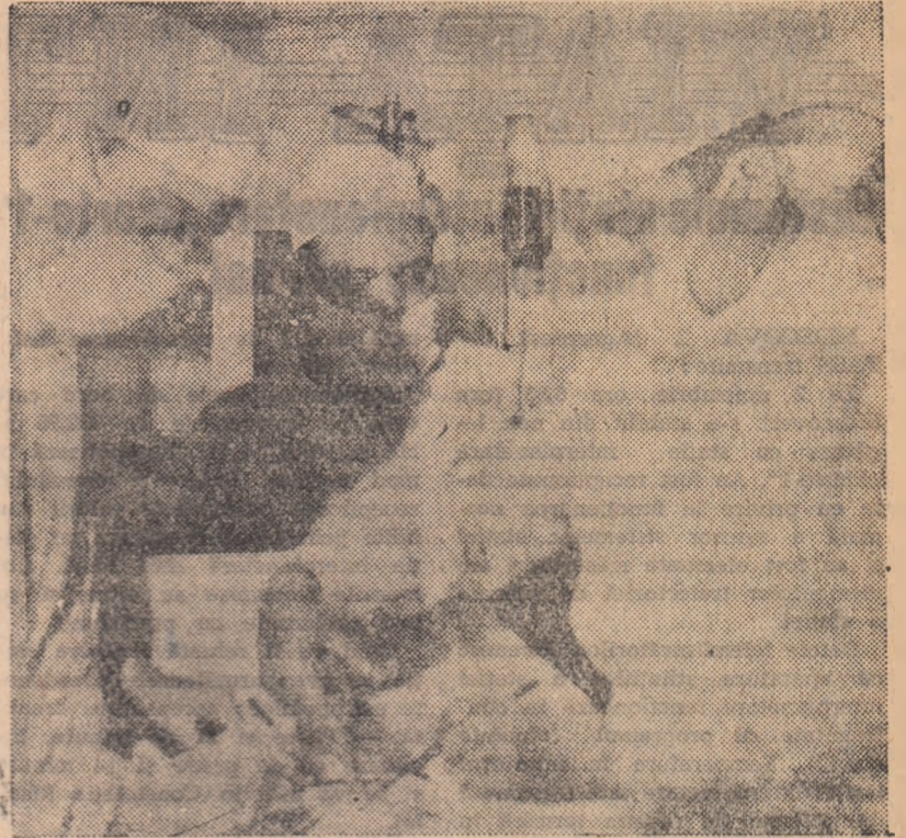
Spitalul unificat Petru Poni este unul din cele mai noi spitale ale Văii Jiului. De la înființarea sa, sute de oameni ai muncii și-au redobîndit aici sănătatea, datorită grijii de care se bucură și strădanilor depuse de personalul medico-sanitar.

Iată un aspect luat în sala de operații.