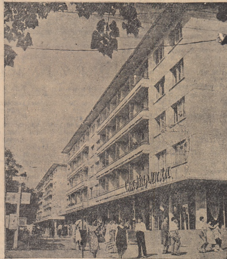
Noi blocuri de locuințe în orașul Stara Zagora.

satisfacerii revendicărilor lor privind îmbunătățirea condițiilor de salarizare a cadrelor didactice, și construirea de noi săli de cursuri și cămine studențești.