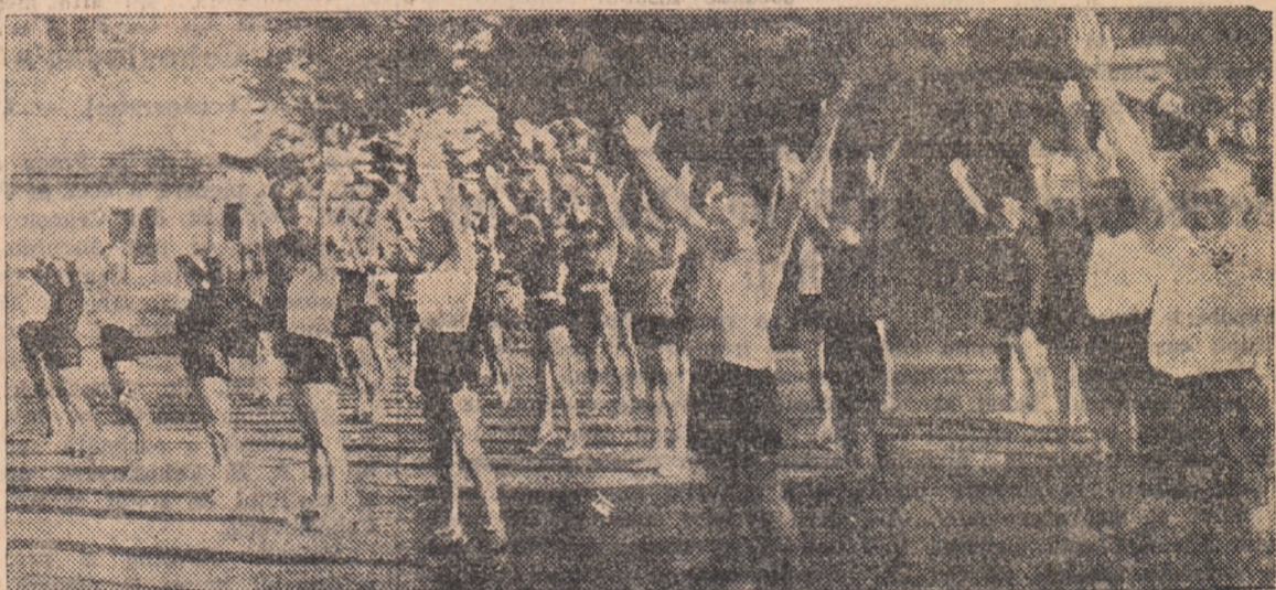
La o oră de educație fizică la Școala de 8 ani nr. 1 din Lupeni.