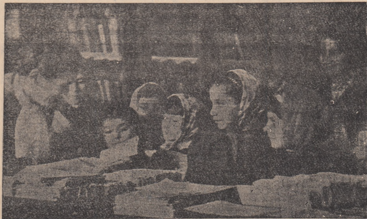
Cartea e un prieten care nu ține cont de vîrstă. Ea oferă cu aceeași plăcere comorile sale fie că e vorba de vîrstnic, fie că e vorba de școlari. Cei mici sînt curioși și nerăbdători de a ști cît mai multe. De aceea în fișele de cititori ai bibliotecii pot fi întîlnite zeci de nume de copii de la clasa I-a și pînă la XI-a.

dr. V. D. TOT pentru conformitate: prof. NICOLAE CHERCIU