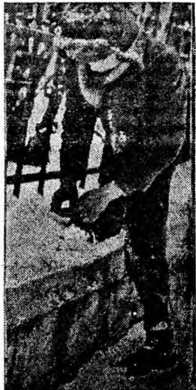
Ultimele pregătiri înainte de a porni în luptă pe oglinda aluncoasă a gheții.

În ziua de 13 ianuarie a avut loc primul concurs de schi în masivul Paring, organizat de asociația Paringul Petroșani. Concursul s-a desfășurat în cadrul Spartachiadei de iarnă a tineretului, avînd ca scop verificarea stadiului de pregătire a schiorilor.