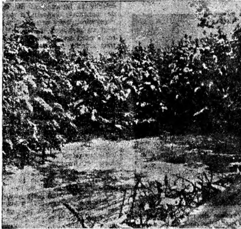
Potana dintre brazii încărcăți cu chiciură pare acum pustie. Din cînd în cînd însă, chiotele de veselie și risul sparg tăcerea, iar printre brazii apar grupuri de schiori urcînd spre înălțimi.

Din cele 16 echipe ce-și dispută înfruntările în campionatul regional, patru sînt din Valea Jiului. Pînă în prezent, cea mai bună comportare a avut-o Minerul Vulcan care la încheierea turului ocupă locul III în clasament la egalitate de puncte cu Minerul Deva, a doua clasată. Cu jucători tineri, o concepție de joc bună, echipa din Vulcan a făcut meciuri frumoase, marcînd goluri multe. Locul următor în clasament este ocupat de Paringul Lonea care în meciul restanță a surclasat cu 7—1 pe Dinamo Barza echipă cu tradiție în fotbal. Mai slab s-a comportat Minerul Aninoasa care cu tot lotul destul de valoros de care dispune se află undeva pe la jumătatea clasamentului. Sub orice critică s-a comportat însă