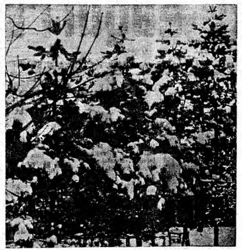
S-a lăsat un ger de crapă pietrele. Brazilor însă puțin le pasă. Inghesuții unul în altul, cu cetinile încoloșmate în plăpumi de zăpadă așteaptă cu răbdare venirea primăverii.

Procedeu experimental pe oameni a dus la vindicări într-un termen mai scurt decît cel normal.