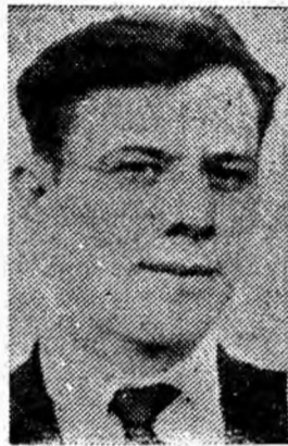
Nășăleanu Miron sectorul I