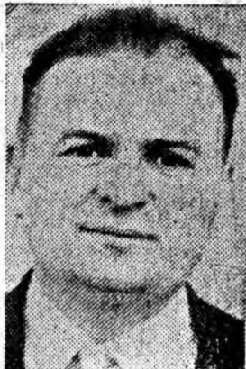
Bria Ioan sectorul II