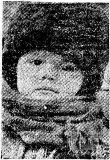
Gata de sănius.

Ea peștera Meziad se poate ajunge fie de la Beiuș (circa 22 km. de stația C.F.R.), fie de la Stîna de Vale, prin Valea Iadului. Vizitarea peșterii se poate face numai cu ajutorul călăuzelor de acolo. Cei care se aventurează singuri sînt în pericol de a se rătăci.