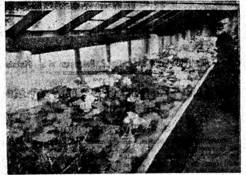
Gerul a împodobit geamurile cu minunate flori de gheață. Toțași, florile naturale din sera de la termocentrala Paroșeni sînt mai preferabile.

✓ Chirurgul englez Lister a fost chemat în miez de noapte la un pacient bogat. După ce a examinat bolnavul, Lister l-a întrebă: — V-ați făcut testamentul? Speriat, pacientul l-a întrebă dacă starea sa este într-adevăr atît de gravă încît trebuie să-și pregătească testamentul. — Chemăți-l imediat pe avocatul dv. și pe cei doi fii. — Fac tot ce cereți — spuse bolnavul zdrobit —, dar spuneți-mi nu mai e nîce o speranță? — Nu — răspunse în sfîrșit