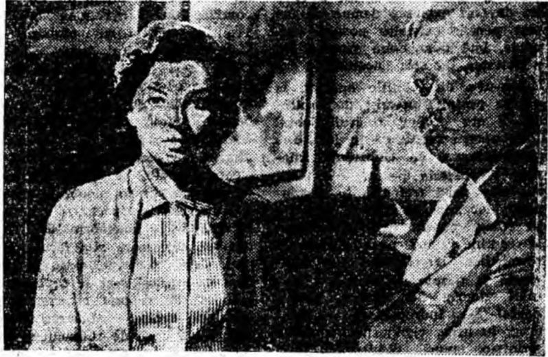
IN CLISEU: Scenă din film.

Julius Fucik, membru al Comitetului Central al Partidului Comunist din Cehoslovacia, luptător neînfricat, arestat de hitleristi în