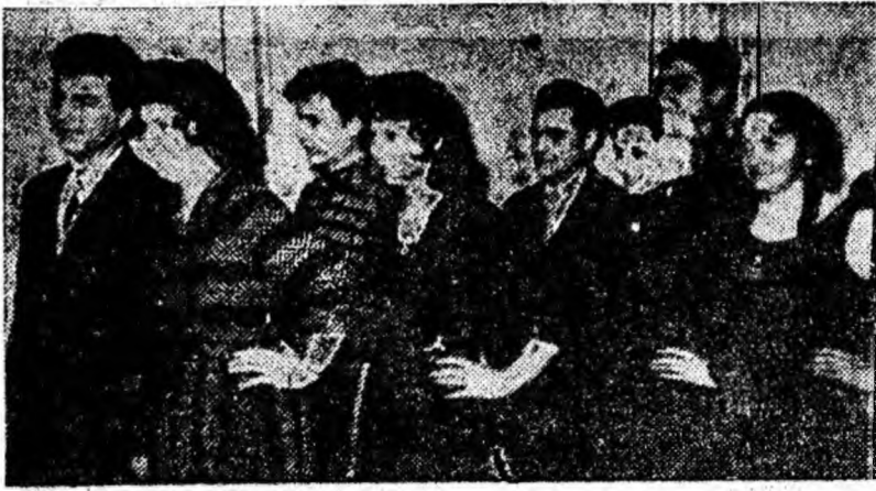
Formația de dansuri în plină repetiție.