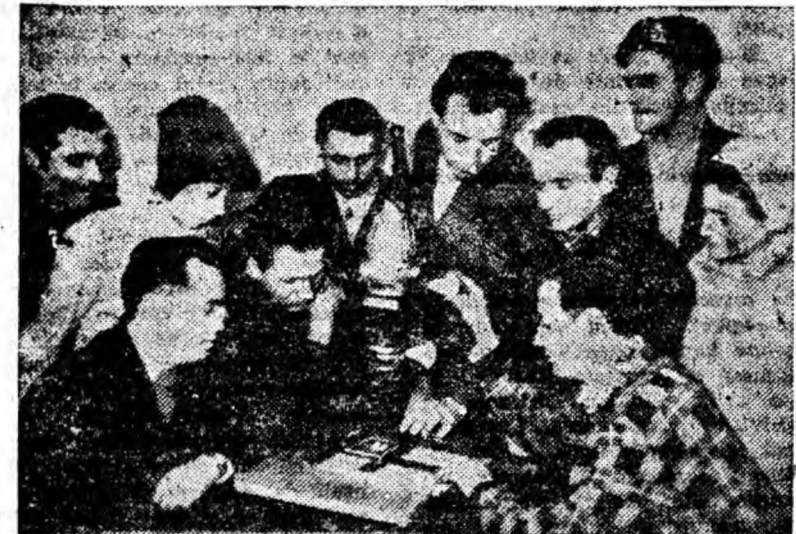
Înainte de a trece la fotografiere, cunoașterea tehnicii aparatelor de laborator este indispensabilă.