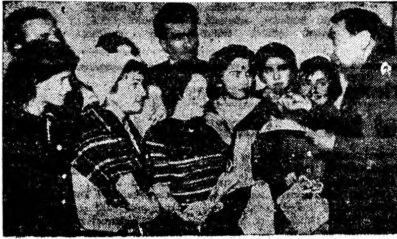
Membrii brigăzii artistice de agitație nr. 2, urmărind îndrumările instructorului lor.