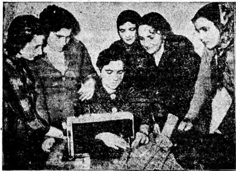
Măinile îndeminate — la lucru.