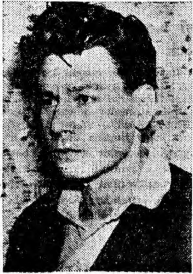
pul creșterii continue a acestui indice al producției.

După expunerea lecției în cadrul cercului la care sînt propagandist îmi rezerv timp pentru studiul individual. La pregătirea fiecărei expuneri îmi sînt nelipsite Directivele Congresului al III-lea al P.M.R., diferite manuale care cuprind problemele de bază ale învățaturii marxist-leniniste și alte lucrări. Tot pentru îmbogățirea expunerilor, mă folosesc de exemple concrete luate din cadrul sectorului și exploatații. Astfel, atunci cînd am vorbit despre productivitatea muncii, am prezentat cursanților o situație concretă privind nivelul creșterii productivității muncii în cadrul sectorului, precum și unele metode ce trebuie să le aplicăm în sco-