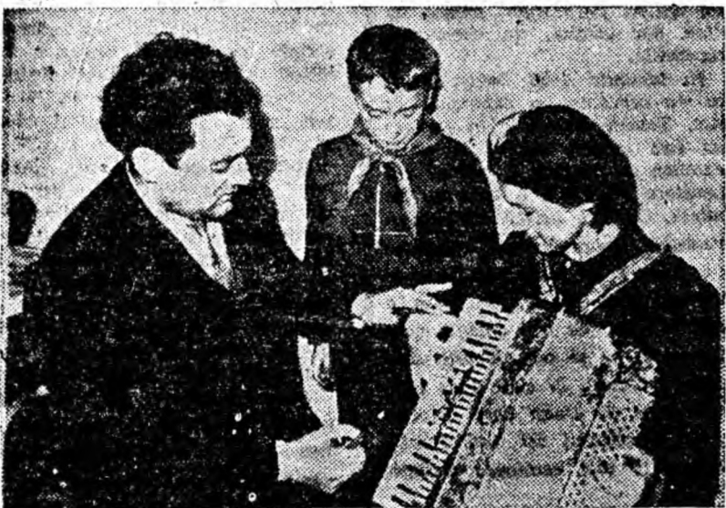
...E greu la început, dar... răbdare. În curând degetele vor parcurge sprintene, drumul clapelor de la acordeon.

Clubul — centrul activității cultural-educative de masă atrage zi de zi tot mai mulți oameni ai muncii. Aici ei își petrec în mod plăcut și util o bună parte din timpul liber. Clubul le oferă posibilitatea de a-și ridica tot mai mult nivelul cunoștințelor politice și de cultură generală, îi educă în spiritul moralei socialiste, le dezvoltă noua atitudine față de muncă, față de avutul obștesc și îndatoririle sociale. Pentru aceasta, la dispoziția oamenilor muncii sînt puse biblioteci, cinematografe, aparate de radio, săli de lectură, diferite jocuri distractive.