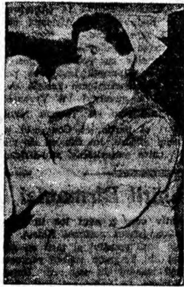
Printre frunțașele întreprinderii Viscoza-Lupeni în preocuparea pentru calitatea producției se numără și tovarăsa Poenaru Otilia. Calitatea mîinii impune pricepere, experiență, răspundere. Sortatoarea Poenaru obține depășiri zilnice de plan de 19—25 la sută.