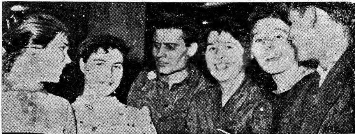
Cțiva membri ai brigăzii artistice de agitație de la Viscoza Lupeni surprinși la o repetiție

De la începutul anului și pînă în prezent minierii din sectorul I al minei Uricani au dat mai mult de 2200 tone de cărbune cocsificabil peste sarcinile de plan.