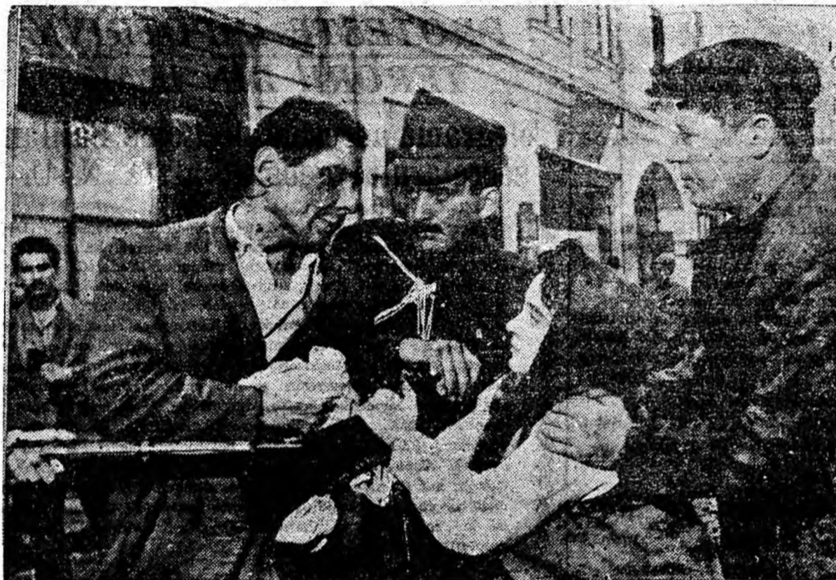
IN CLISEU: Un cadru din film.