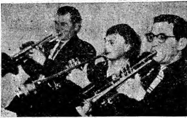
Aspecte de la o recepție a orchestrei semisimfonice din Petroșani.