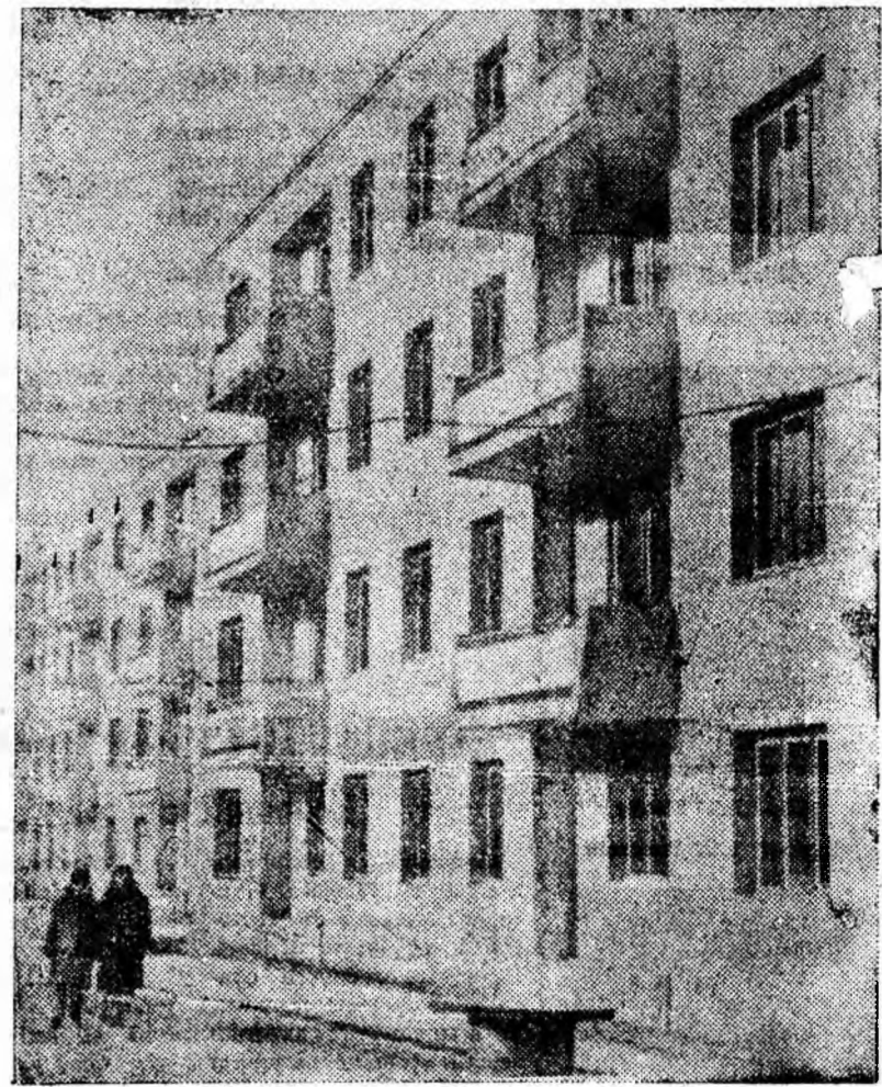
○ imagine a Vulcanului de astăzi.

Acestea sînt numai cîteva din rezultatele muncii desfășurate în anul ce a trecut de gospodării co- munei, realizate la propunerea și cu concursul locuitorilor din co- mună. Pentru realizarea acestor o- biective, au fost prestate 21160 ore de muncă patriotică, la care au participat peste 3200 de lo- cucitori. Valoarea lucrărilor se ri- dică la suma de 51260 lei.