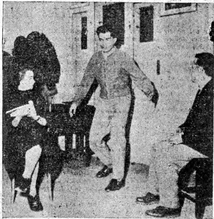
Tinerii din anul III a Școlii populare de artă Petroșani pregătesc o nouă piesă care în curând va fi pusă în scenă. Clișeul de față reprezintă un aspect de la repetițiile cu piesa „Passacaglia” de Titus Popovici.