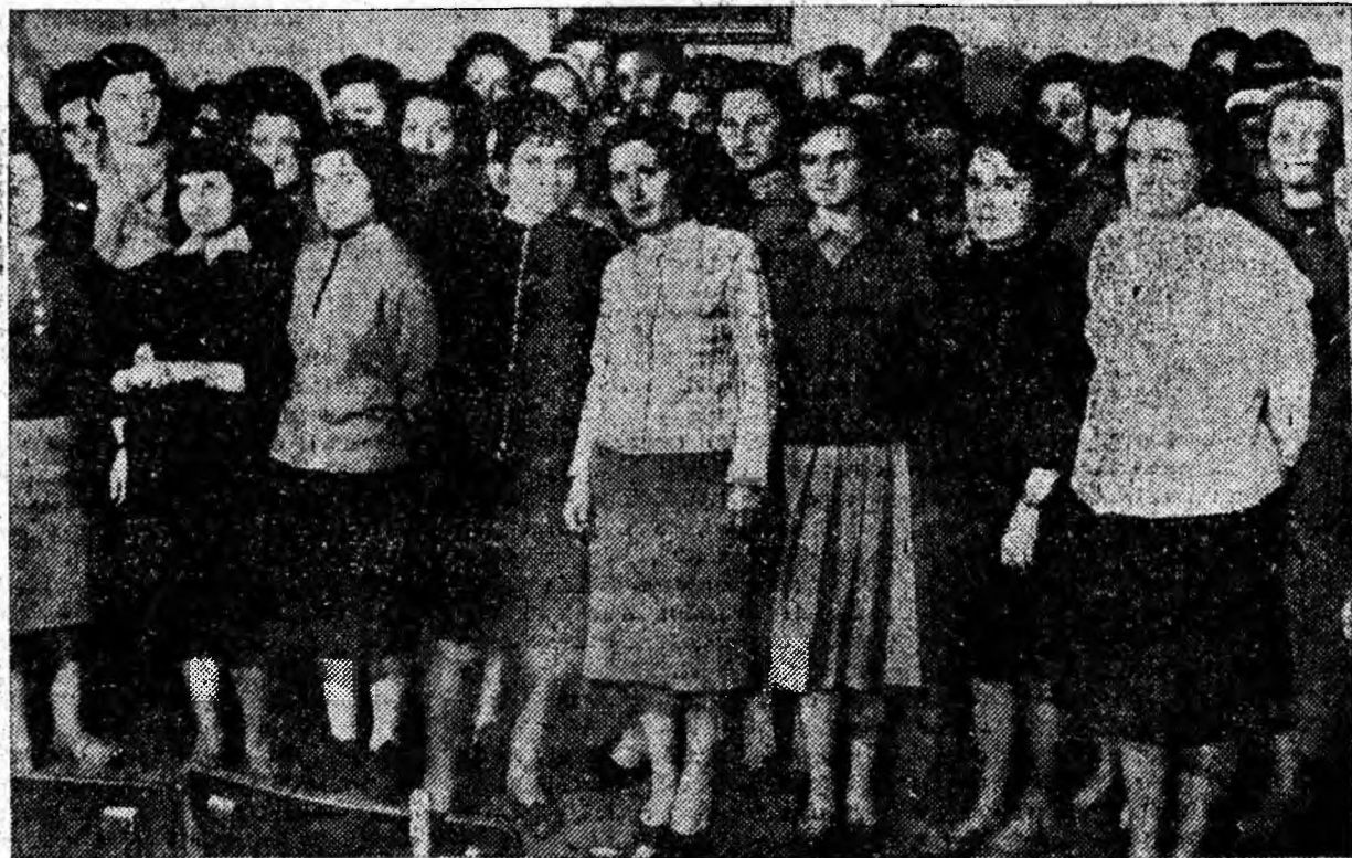
Corul clubului sindicatelor din Lupeni se pregătește cu un program bogat pentru sărbătorirea zilei de 1 Mai. Clîșeul de mai sus înfățișează corul la una din repetiții.