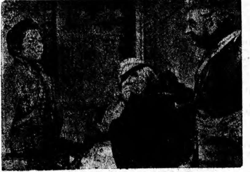
IN CLISEU: O scenă din film.

In tolu balului se anunță că armata lui Bonaparte a invadat pămîntul Rusiei. Camarazii trec la arme. Surocika, deghizată în uniforma de cornet, luptă vitejește, sub numele de Azarov, alături de ceilalți camarazi, avînd ocazia să observe dragostea lui Rjevski pentru celebra cîntăreață franțuzoaică Gernone. Dovădind curaj și înge-