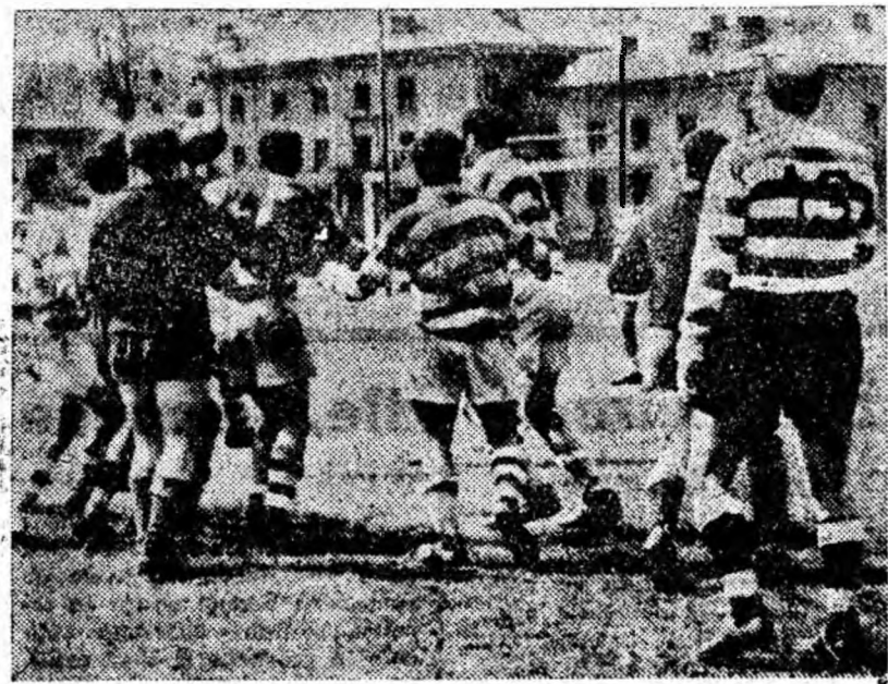
Meciul de rugbi dintre Știința Petroșani și Dinamo București a dat cliștig de cauză oaspeților. Ei s-au dovedit mai buni în toate compartimentele. În clișeu o fază din întilnire.