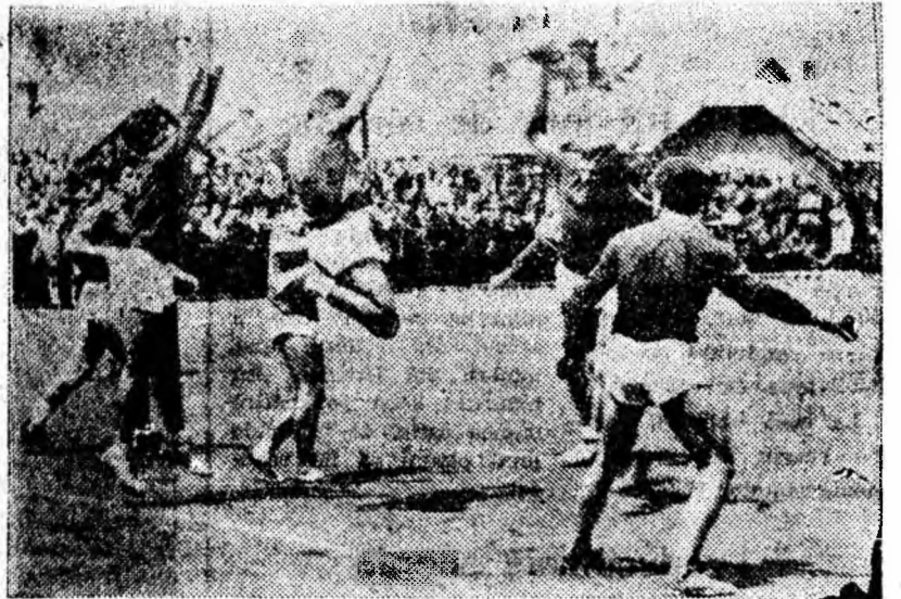
IN CLISEU: Fază din întîlnirea de handbal de la stadionul Jiul.

— Nu ți-am spus că batem — se umbla în pene optimistului. — Ce, încă eu am fost, contra? — Și încă facem scor, acul-tă-mă pe mine. — Scor mare nu cred. Principaler e să batem. Fluierul al arbitrului consfințea victoria și încă la scor a petroșanienilor. 22-15 în favoarea lor. Spectatorii au aplaudat minu-