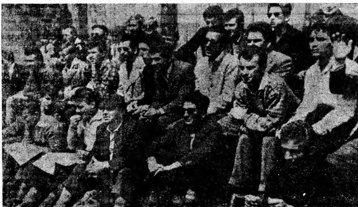
Deși meciurile de handbal în 7 se joacă acum pe stadionul Jiul și în tribune sînt destule locuri, spectatorii preferă să fie cît mai „aproape” de jucători. Cînd vezi un meci frumos, covorul verde al terbil înlocuiește cu succes tribuna.

ETAPA VIHOARĂ: Minerul Aninoasa — Sebeșul Sebeș; C.F.R. Simeria — Minerul Deva; Parîngul Lonea — C.F.R. Teiuș; Minerul Ghelar — Dacia Orăștie; Siderurgistul Hunedoara — Retezatul Hațeg; Jiul II Petrila — Constructorul Hunedoara; Minerul Vulcan — Dacia Alba Iulia; Victoria Călan — Aurul Brad.