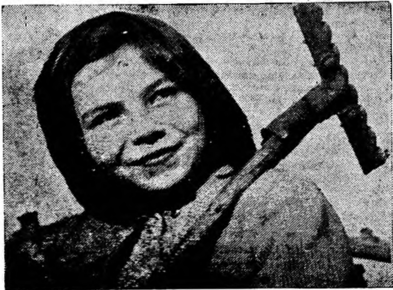
Spre casă după munca voluntară.

(Citiți în pagina a 3-a: Materiale pe marginea dezbaterilor plenarei Comitetului orășenesc de partid).