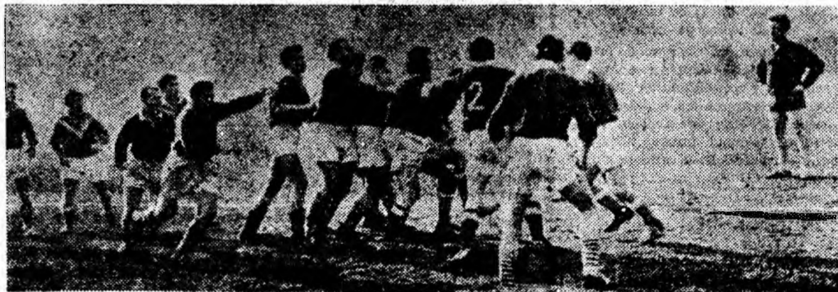
ÎN CLIȘEU: Deși mai veche, poza de față dovedește spectaculozitatea jocului de rugbi.