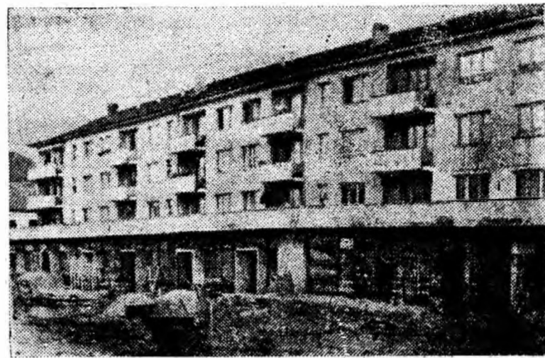
A trecut un an și jumătate de cînd constructorii de la Lupeni au început lucrările la blocul 9 — din clișeu. Apartamentele sînt locuite deja de anul trecut dar... magazinele de la parter nu sînt gata nici acum.

Iată deci citeva probleme legate de munca de educare a candidaților în perioada stagiului asupra căroră biroul organizației de bază din sectorul V al minei Vulcan e dator să reflecte. Trebuie luate măsuri de înlăturare a deficiențelor semnalate spre a asigura folosirea din plin a stagiului de candidatură pentru formarea viitorilor membri de partid. În această direcție biroul acestei organizații de bază e necesar să fie ajutat îndeaproape de comitetul de partid al minei.