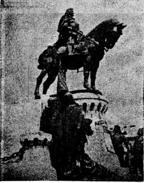
IN CLISEU: Statuia lui Matei Corvin din Cluj.