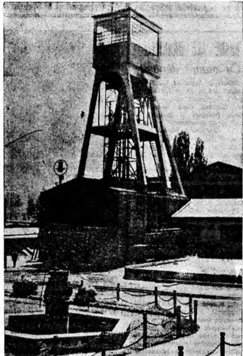
Turnul pușului Ștefan de la mina Lupeni. Pe acest puț se extrage la ziud o bună parte din cărbunele furnizat cocsării hunedoreni.