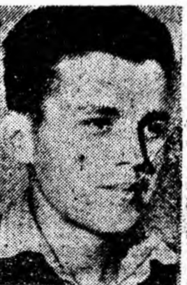
PASĂRE POMPIBIU Lupeni