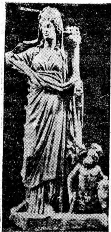
IN CLIȘEU: grupul statuar Fortuna și Pontos (marmură, secolul II e.n.) dezgropat la Constanța.

Litoralul! Cu mii de ani în urmă aici au acostat corăbierii și negustorii Feniciei, au urcat în susul Dunării argonauții, apoi armatele co-