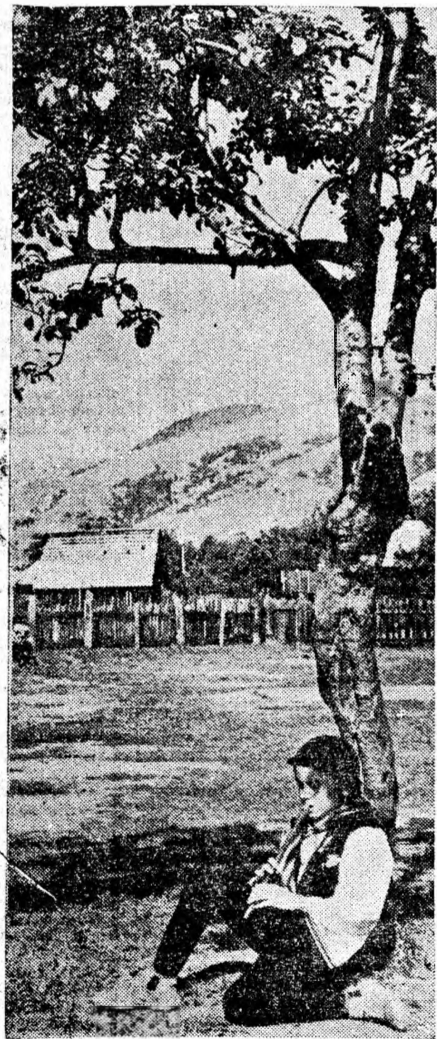
Dealurile, casele și pomii sînt culundate într-o tainică ascultare. Auru! soarelui, valurile de lumină ale zilei, adierea parfumată a verii pare că nu te-a impresionat atât de puternic ca doina voinicului din fotografie care cîntă noile vremuri.

...Cîțiva școlari din Lugansk, care strîngeau fier vechi în cadrul campaniei de recuperare a metalelor