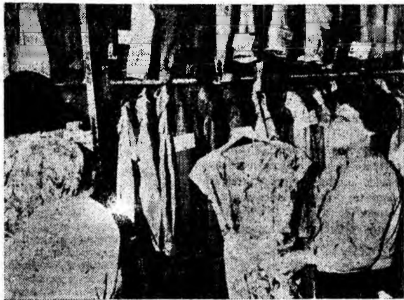
În anolimpul imprimeturilor, al rochilor subțiri. Magazinele de desfacere ale acestor produse mult căutate de cumpărători cunosc o afuență mare în aceste zile de început de vară. Fotoreporterul nostru a surprins un aspect de acest fel într-unul din magazinele de conectii.