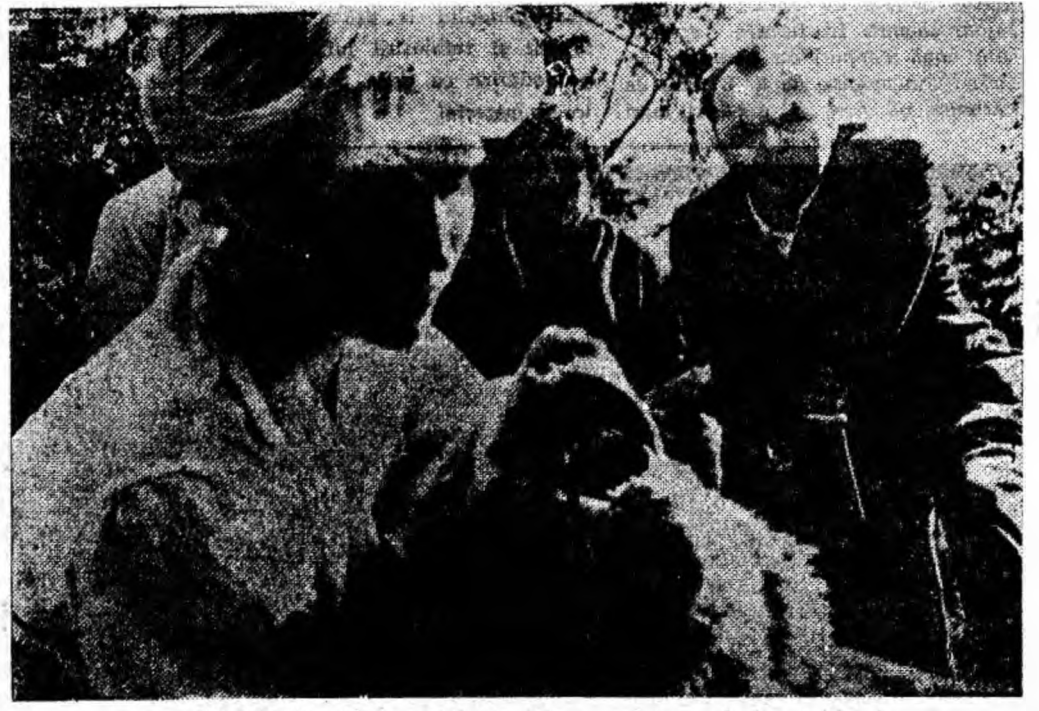
IN CLIȘEU: O secvență din film.

gostei”, „Al 41-lea”, „Garnizoana Nemuritoare”, „Simfonia Leningradului”, „Marinarul îndrăgostit”, și din alte filme, producții sovietice, care au rulat pe ecranele cinematografulor noastre. De remarcat că rolul lui Semion Teterin, interpretat de Kriucikov în filmul „Judecata” este al 70-lea rol al său în cinematografie.