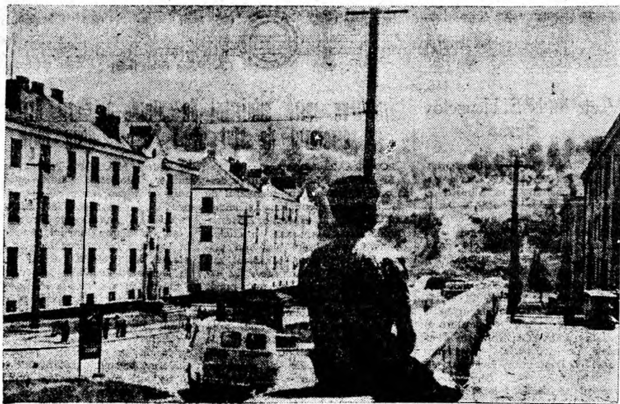
Urmasii de azi.