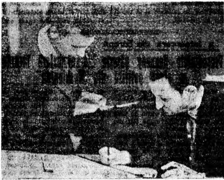
La serviciul mecanic șef al Viscozei Lupeni se execută proiectul unor burlane de descărcare a buncărului, de la casa cazanelor.

Burlanele, care deocamdată sînt abia schițate pe hîrtia de calc, vor contribui la reducerea efortului fizic al muncitorilor de la casa cazanelor.