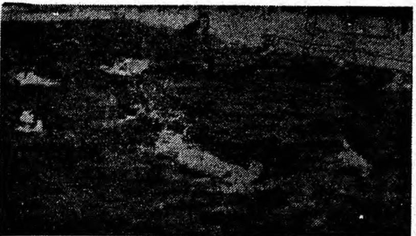
Căldura toridă din ultimele zile a făcut ca ștrandurile să fie mult căutate. După cum se vede și din clișeu, la ștrandul din Petrița sunt mulți amatori...

Golfstreamul nu este cel mai mare curent din Oceanul Pacific. In jurul Antarctidei, prin mările care o scaldă curge un „riu” lat in unele locuri de 1300 km. Se numește Deriva răsăriteană sau curentul Vinturilor apusene. In virtejurile lui este atrasă o cantitate de 6 milioane de kilometri cubi reprezentând a 200-a parte din apa oceanelor de pe planeta noastră. Apele superficiale ale curentului Inconjoară continentul o dată la 16 ani.