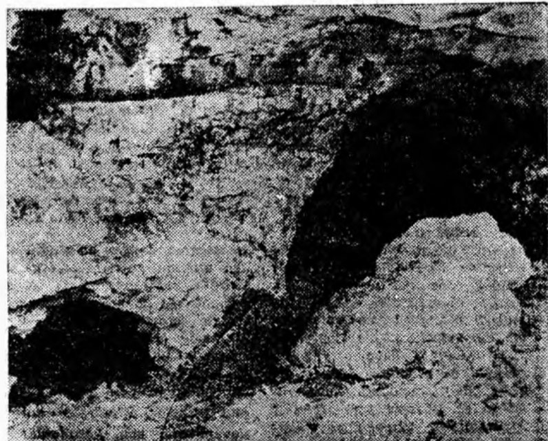
ÎN CLISEU; Vă prezentăm cele două intrări spre Peștera Liliacilor din Valea Polatiștei.

Interesante de vizitat sînt și celelalte peșteri situate în susul Văii Polatiștei, în special Peștera nr. 4 care dezvoltă în interiorul ei un soi de mușchi nemai întîlnit în altă parte la noi în țară.