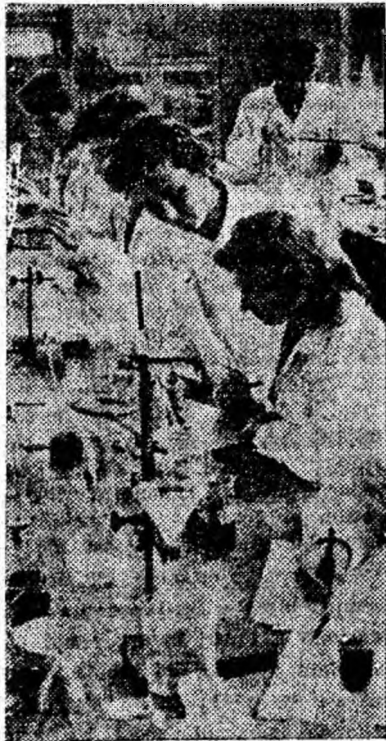
În laboratorul de chimie analitică, față de proprietățile substanțelor, cu legile lor de reacție chimică.

Totodată, activitatea științifică studențească este îndreptată spre lucrări cu caracter politico-ideologic, precum și pe tărîmul matematicilor, al fizicii. Cercurile studențești din cadrul institutului au susținut cu succes comunicări în cadrul conferințelor pe țară ale cercurilor științifice, iar reprezentanții studenților institutului din Petroșani au obținut rezultate remarcabile în ultimii ani în cadrul concursurilor de matematică, fizică și mecanică organizate pe țară de Ministerul Învățământului în colaborare cu C.C. al U.T.M., O.A.S.R., Societatea de științe matematice și fizice din R.P.R.