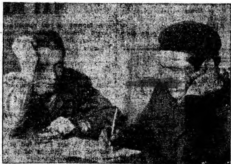
La clubul muncitoresc din Petrla. Într-un birou, în liniște, doi tineri stau gînditori aplecați asupra unui caiet. Sînt membri ai colectivului de creație. Ce fac ei? Crează desigur un nou program pentru brigada artistică de agitație a clubului.

În încheiere, a luat cuvîntul tovarășul Lazăr David, prim-secretar al comitetului orașenesc de partid. Vorbitorul a subliniat necesitatea ca în viitor să se pună un accent mai mare pe antrenarea oamenilor muncii la activitatea cultural-educativă de masă. Trebuie să se creeze noi formații artistice, să se organizeze mai multe acțiuni cu cartea tehnică, atractive și interesante. În centrul atenției consiliilor de conducere ale cluburilor va trebui să stea în continuare problema calității producției și respectarea cu strictețe a N.T.S. Cabinetele tehnice să se preocupe cu mai mult simț de răspundere de calificarea și ridicarea calificării muncitorilor. De asemenea, timpul liber al oamenilor muncii să fie organizat mai judicios, plăcut și util.