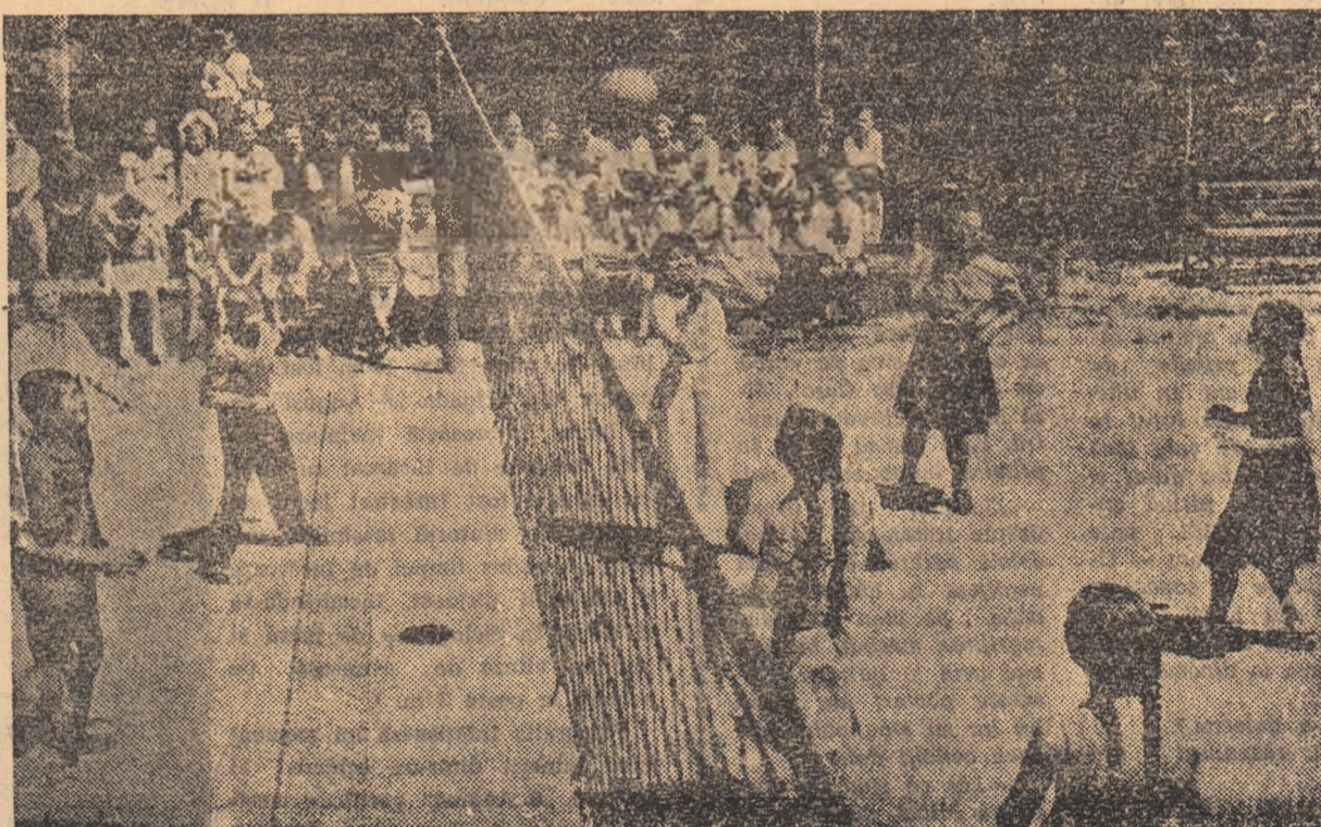
În timp ce în școli au loc pregătiri intense pentru deschiderea noului an școlar, elevii se află în plină vacanță. Majoritatea din ei, care nu au plecat în tabere în alte localități, își petrec timpul în mod recreativ și instructiv în taberele locale. Aici ei își fortifică forțele în vederea deschiderii noului an școlar.

De fapt așteaptă toți: I.L.L.-ul să termine devizul cei de la S.S.A., conducerea școlii așteaptă să se aprovizioneze I.L.L. cu materialele necesare, elevii își așteaptă și ei cu nerăbdare clasele să vadă cum arată. Doar începerea anului școlar nu așteaptă. Curînd, noul an școlar va bate la ușă. Poate că mai are totuși de spus ceva și secția de învățământ, care nu a curmat acest lanț al slăbiciunilor. Nu cumva s-a prins și ea de el?