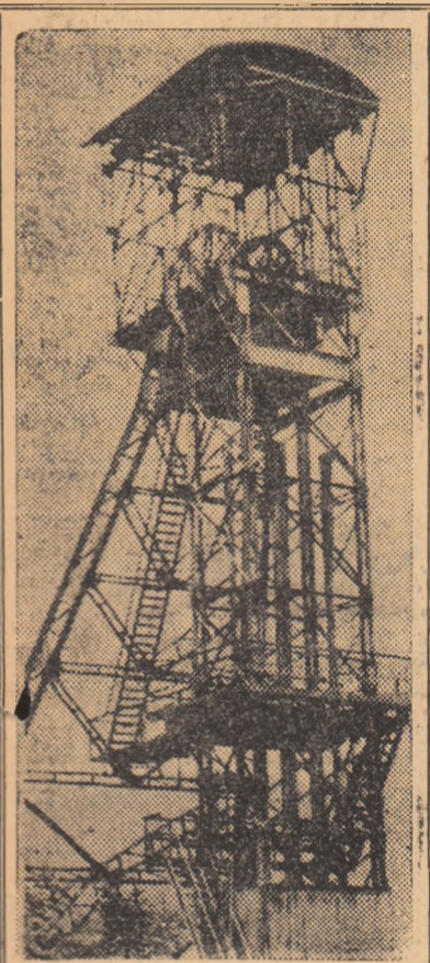
Construită din metal, turla puțului se înalță spre zărilor albastre. Deși e auxiliar, puțul din clișeu face zi și noapte legătura dintre suprafață și adîncurile minei Petrila.