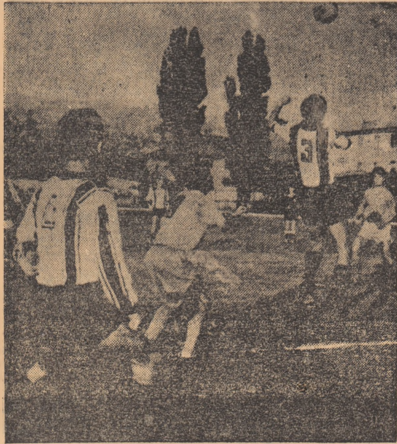
IN CLISEU: Un nou atac la poarta oaspeților.

Ne așteptam din partea voastră La un atac mai insistent Dar acțiunile întreprinse Au fost ca la... antrenament!