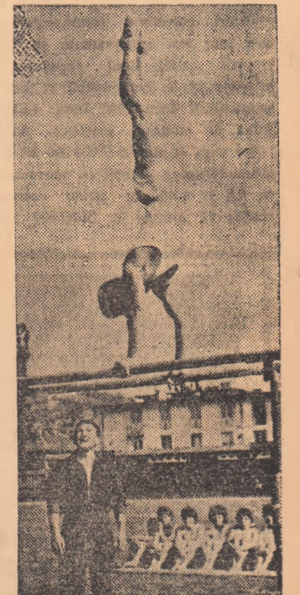
competente să țină cont de această propunere. În cele două clișee se pot vedea cîțiva dintre participanții la demonstrație... la lucru.