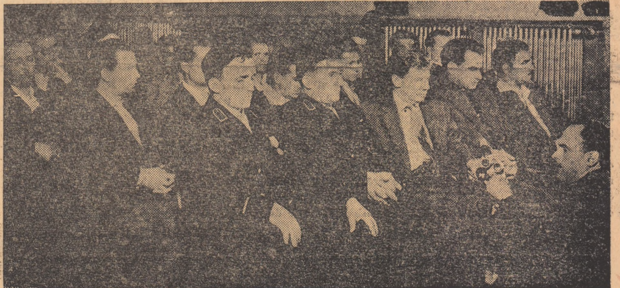
Aspect din timpul adunării festive.

căroră minerii le vor da viață cu siguranță — cheazăse fiind grija partidului și statului nostru pentru a îmbunătăți continuu condițiile de muncă și de viață ale minerilor, precum și hotărîrea minerilor de a răspunde prin fapte grijii și dragostei cu care sint înconjurați. În cadrul sărbătoririi, o deose-