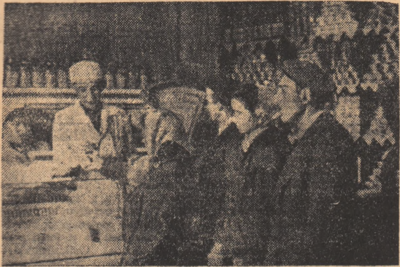
In anii noștri, rețeaua magazinelor de desfacere din Petrița a cunoscut o largă dezvoltare. Aproape că nu există cartier fără magazine mari și frumoase. IN CLISEU: Se vede doar interiorul unuia din magazinele petrițene.