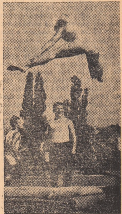
O spectaculoasă săritură a unui tînăr gimnast.