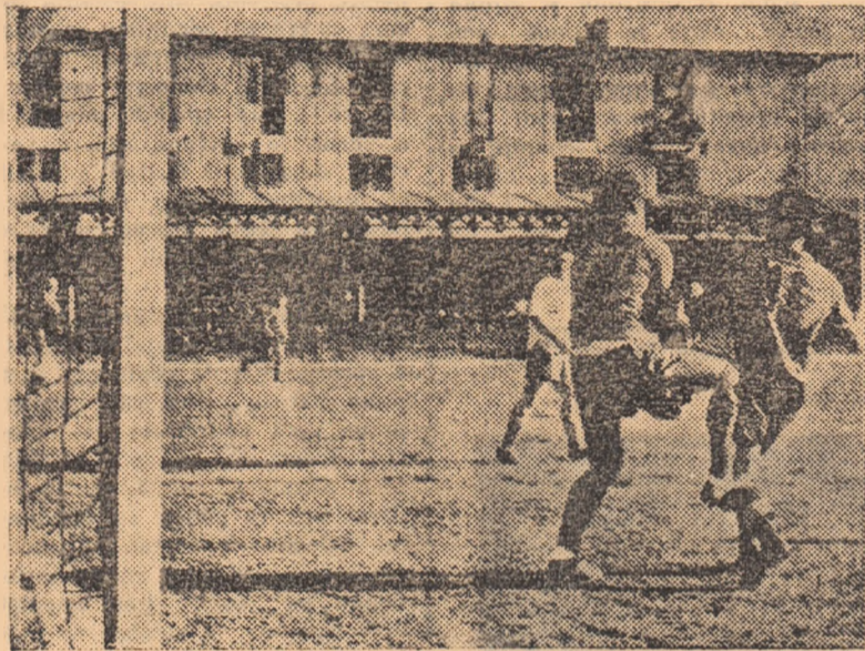
Un nou atac la poarta oaspeților.

Într-un ritm viu din primul minut și pînă la fluierul final al arbitrilor.