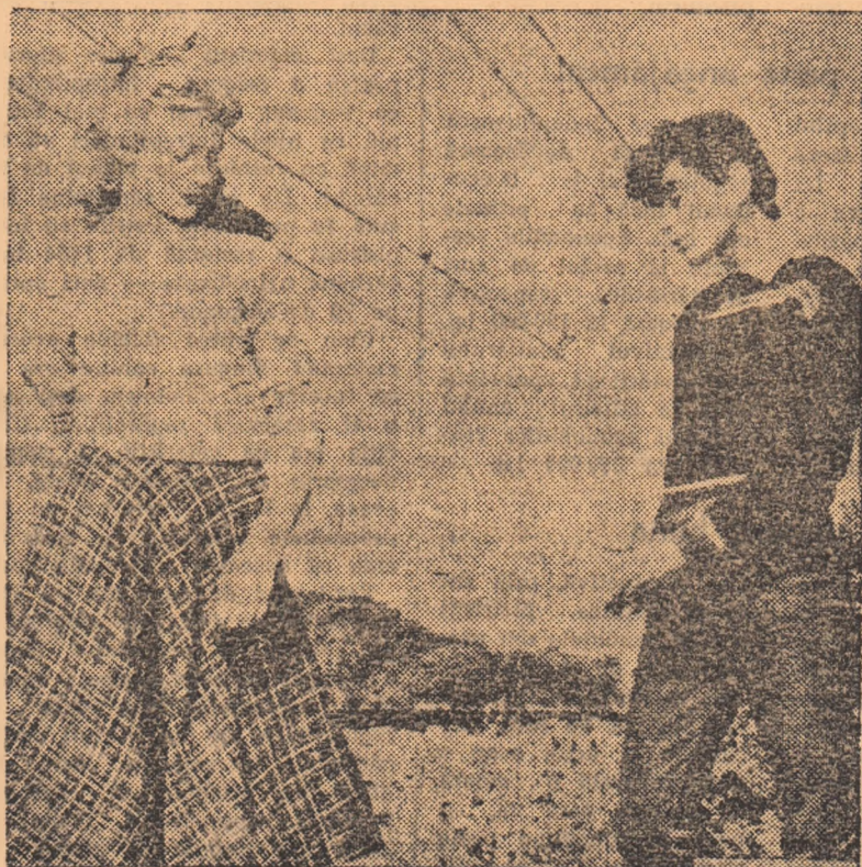
IN CLIȘEU: Un cadru din film.

Cartea lui Robert Jungk întărește convingerea că trebuie făcut totul pentru ca lumea să fie salvată de ororile războiului atomic.