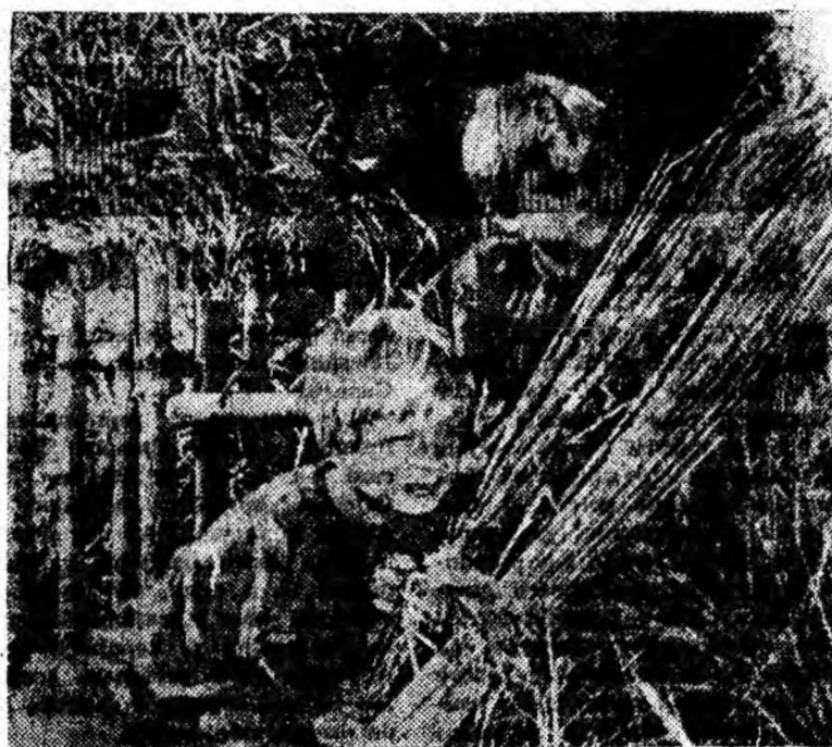
Incepînd din 14 octombrie la cinematograful „7 Noiembrie” din Petroșani va rula filmul în culori, pe ecran lat, „Cei doi care au furat luna”.