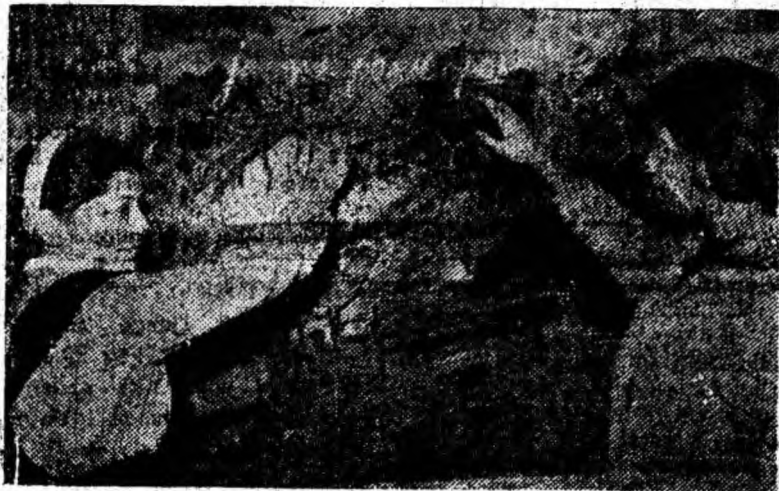
Printre orele de curs mult îndrăgite de elevii din clasa a VII-a de la Școala de 8 ani nr. 2 din Vulcan sînt și cele de limba franceză. De aceea, ei vin întotdeauna la școală pregătiți și cu temele făcute.

Fotoreporterul nostru a surprins zilele trecute un aspect de la o astfel de oră de curs la clasa a VII-a A.