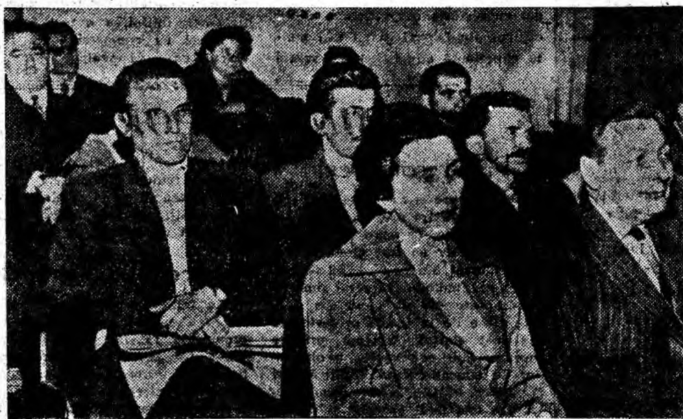
Sîmbătă 12 octombrie a.c. la Petroșani, în sala teatrului, a avut loc adunarea festivă organizată cu prilejul celei de-a 15-a aniversări a înființării Teatrului de stat „Valea Jiului”.

La adunare au luat parte activiști de partid și de stat, actori, conducători de întreprinderi și instituții, oameni ai muncii.