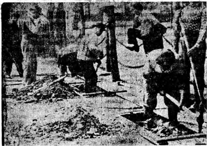
De puțin timp, la Aninoasa a început construcția unei hale de piață, în valoare de 220 000 lei. IN CLIȘEU: Lucrările de săpături a fundației noii construcții.

creșterea și educarea activului fără de partid, felul cum folosesc organizațiile de bază activul fără de partid în acțiunile inițiate în vederea întăririi economice și organizatorice a gospodăriilor colective, pentru dezvoltarea conștiinței socialiste a colectivităților.