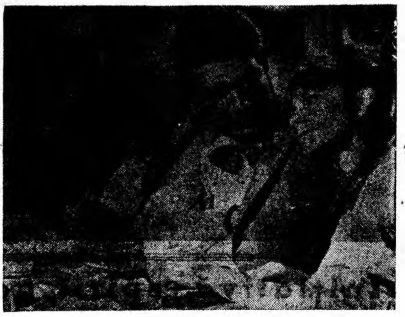
IN CLISEU: O secvență din film.