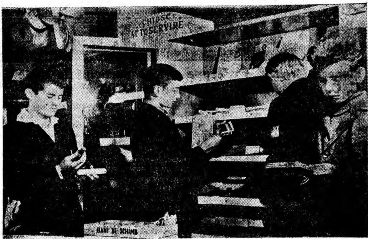
La Școala profesională din Lupeni există un chioșc cu rechizite școlare și diferite obiecte de toaletă cu vînzare prin autoservire. ÎN CLIȘEU: După cum se poate observa, vînzător nu există. Elevii își cumpără singuri obiectele ce le sînt necesare.

Iată de ce un grup de oameni ai muncii din Uricani întrebă printr-o scrisoare adresată redacției ziarului nostru: de ce nu se i-au măsuri pentru asigurarea unei bune serviri la această unitate?